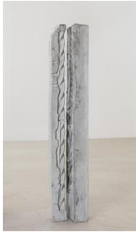
JUNE CRESPO To be two, 2018 Beton 125 x 22 x 17 cm