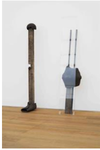
KATINKA BOCK Palermo e Palermo, 2013 Glas, Keramik, Holz, Metall Maße variabel