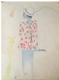
SOPHIE PODOLSKI Untitled, 1966-67 Buntstift auf Papier 36 x 27 cm, gerahmt 58 x 46,5 cm Collection of Catherine Podolski. Brüssel