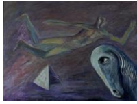
AHMED MORSI Flying Poet (1), 1984 Acryl auf Leinwand 60 x 80 cm