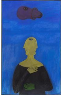
AHMED MORSI Flying Horse, 2004 Acryl auf Leinwand 245 x 155 cm Courtesy of Gypsum Gallery, Cairo, and Ahmed Morsi