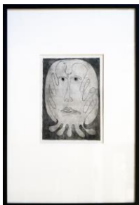
SOPHIE PODOLSKI L'oiseau, Druck 1967 Radierung, originaler schwarzer Holzrahmen Plattengröße 15,7 x 25 cm gerahmt 62 x 42 cm Collection of Catherine Podolski. Brüssel