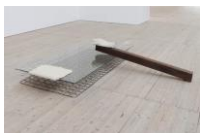
KATINKA BOCK _o_o_o (Liegende), 2017 Holz, Keramik, Glas, Metall 40 x 235 x 205 cm