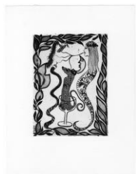
SOPHIE PODOLSKI Untitled, 1968-69, Druck 1982 Radierung, Ed 4/4 Plattengröße 20 x 14,5 cm, Blattgröße 33,5 x 25,5 cm gerahmt 62 x 42 cm