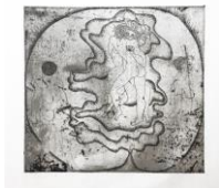
SOPHIE PODOLSKI Untitled, ca. 1968-69, Druck 1982 Radierung, Ed. 4/4 Plattengröße 22,8 x 24,2 cm, Blattgröße 56,5 x 38 cm gerahmt 62 x 42 cm