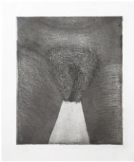
SOPHIE PODOLSKI Les anneaux d'or, 1969, Druck 1982 Radierung, Ed 4/4 Plattengröße 22 x 17,8 cm, Blattgröße 54 x 37,7 cm, gerahmt 62 x 42 cm