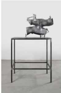
JUNE CRESPO Helmets I, 2019 Aluminium 55 x 67 x 47 cm, Sockel 80 x 57 x 96 cm Privatsammlung