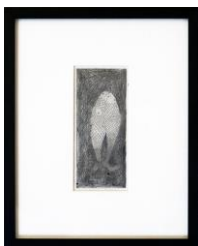
SOPHIE PODOLSKI Les poissons, 1967 Radierung, originaler schwarzer Holzrahmen Plattengröße 15,8 x 6,7 cm 32 x 26 cm, gerahmt gerahmt Collection of Catherine Podolski. Brüssel