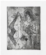
SOPHIE PODOLSKI Untitled, 1968-69, Druck 1982 Radierung, Ed. 4/4 Plattengröße 13,5 x 9,8 cm, Blattgröße 54 x 38 cm gerahmt 62 x 42 cm Collection of Catherine Podolski. Brüssel