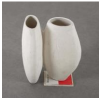
JUNE CRESPO To be two, 2018 Keramik, Gips, Buch 57 x 45 x 30 cm