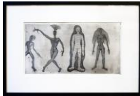
SOPHIE PODOLSKI Momie, ca. 1968-69, Druck 1982 Radierung, originaler schwarzer Holzrahmen Plattengröße 22,5 x 42,8 cm, gerahmt 42 x 62 cm Collection of Catherine Podolski. Brüssel