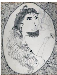
SOPHIE PODOLSKI Femme à barbe, 1966 Tinte auf Papier 36 x 27 cm, gerahmt 58 x 46,5 cm Collection of Catherine Podolski. Brüssel