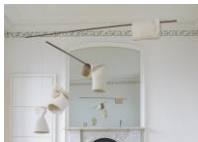
KATINKA BOCK Conversation suspended, Glasgow, 2018 Keramik, Drahtkabel, Kupferrohre, Kupferplatten Maße variabel