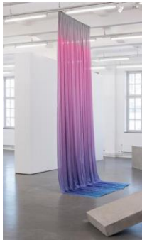
FLAKA HALITI Just Hanging Around #2, 2017 Vorhang aus Seide, Ombre-Dip-Dye-Farbdruck in Grau, Blau und Weiß ca. 700 x 250 cm