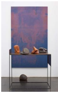
KATINKA BOCK Five Speakers, 2014/2018 Metall, Kupfer, Keramik, Leinen 235 x 110,5 x 165 cm Metallsockel: 111 x 110,5 x 75 cm Leinen: 205 x 124,5 x 5 cm Keramikobjekte je: 30 x 25 x 25 cm