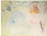
SOPHIE PODOLSKI Untitled, 1966-67 Buntstift auf Papier 27 x 36 cm, gerahmt 46,5 x 58 cm Collection of Catherine Podolski. Brüssel