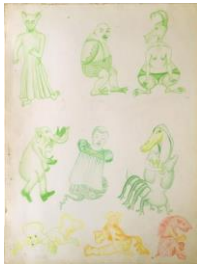
SOPHIE PODOLSKI Untitled, 1966-67 Buntstift auf Papier 36 x 27 cm, gerahmt 58 x 46,5 cm Collection of Catherine Podolski. Brüssel