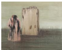
TOYEN Dream, 1937 Öl auf Leinwand 81 x 100 cm, gerahmt 100,5 x 119,5 x 5 cm Kunsthalle Praha, Prag