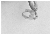
KATINKA BOCK _O_O_O (red and green), 2017 s/w Super 8 Film digitalisiert, ohne Ton Ed.1/4 + A.P 2 min. 50 sec.