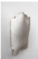
KATINKA BOCK Vergessen, 2019 Keramik 38 x 25 x 14 cm