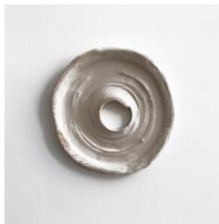
KATINKA BOCK Sound, 2019 Keramik 36 x 35 x 3 cm