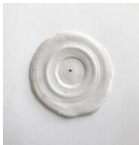
KATINKA BOCK Sound, 2019 Keramik 26,5 x 25,5 x 1 cm