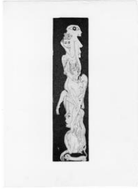
SOPHIE PODOLSKI Untitled, 1968-69, Druck 1982 Radierung, Ed. 4/4 Plattengröße 29,6 x 7,2 cm, Blattgröße 38 x 27,7 cm gerahmt 62 x 42 cm