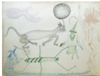
SOPHIE PODOLSKI Untitled, 1966-67 Buntstift auf Papier 27 x 36 cm, gerahmt 46,5 x 58 cm Collection of Catherine Podolski. Brüssel