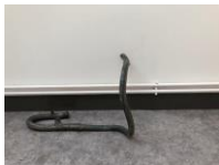
KATINKA BOCK Piombino, 2018 Bleirohre Maße variabel